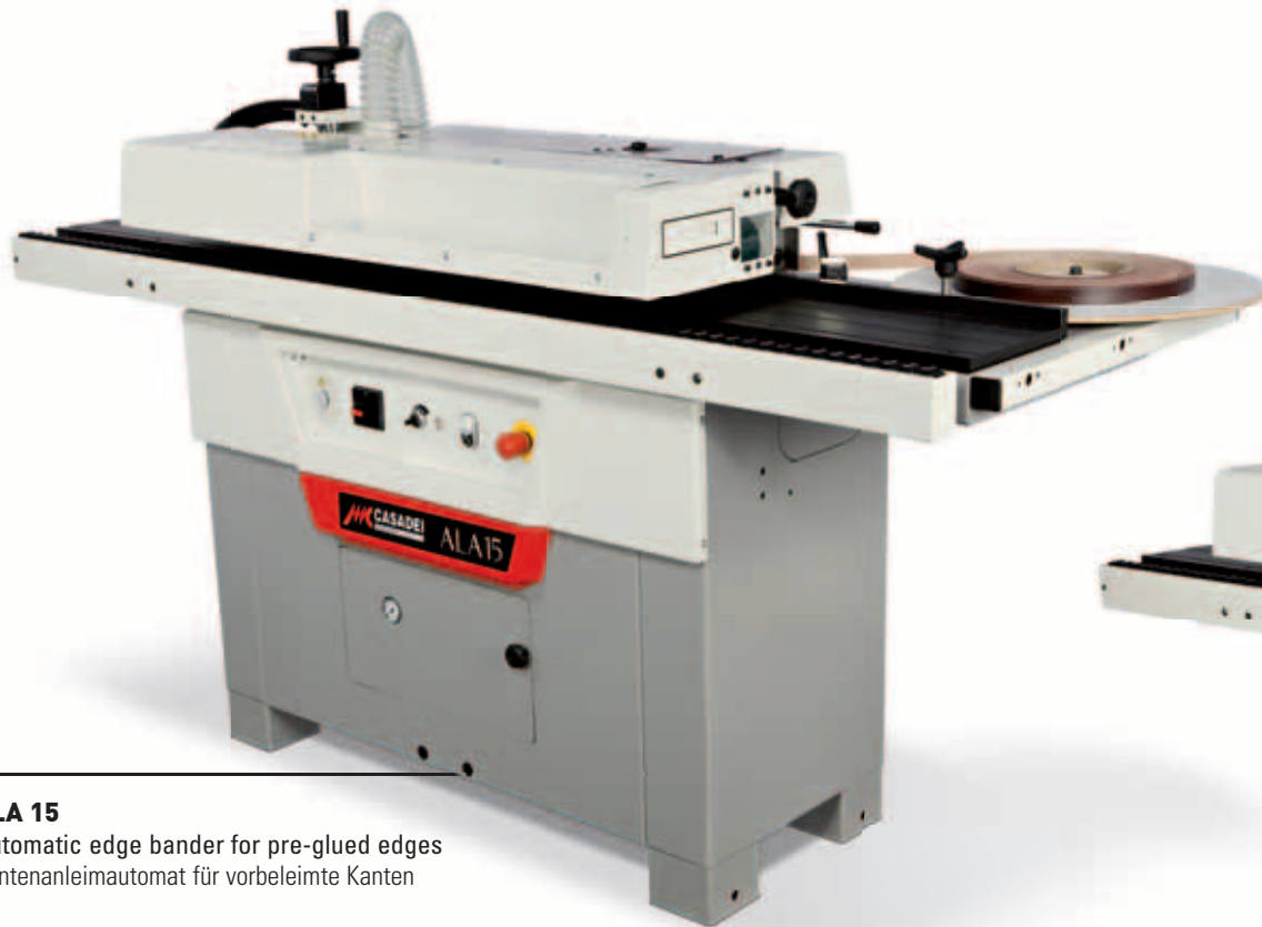
ALA 15 Automatic edge bander for pre-glued edges Kantenanleimautomat für vorbeleimte Kanten