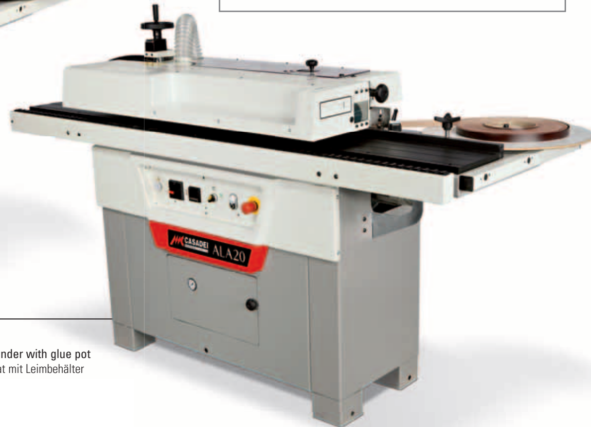
ALA 20 Automatic edge bander with glue pot Kantenanleimautomat mit Leimbehälter