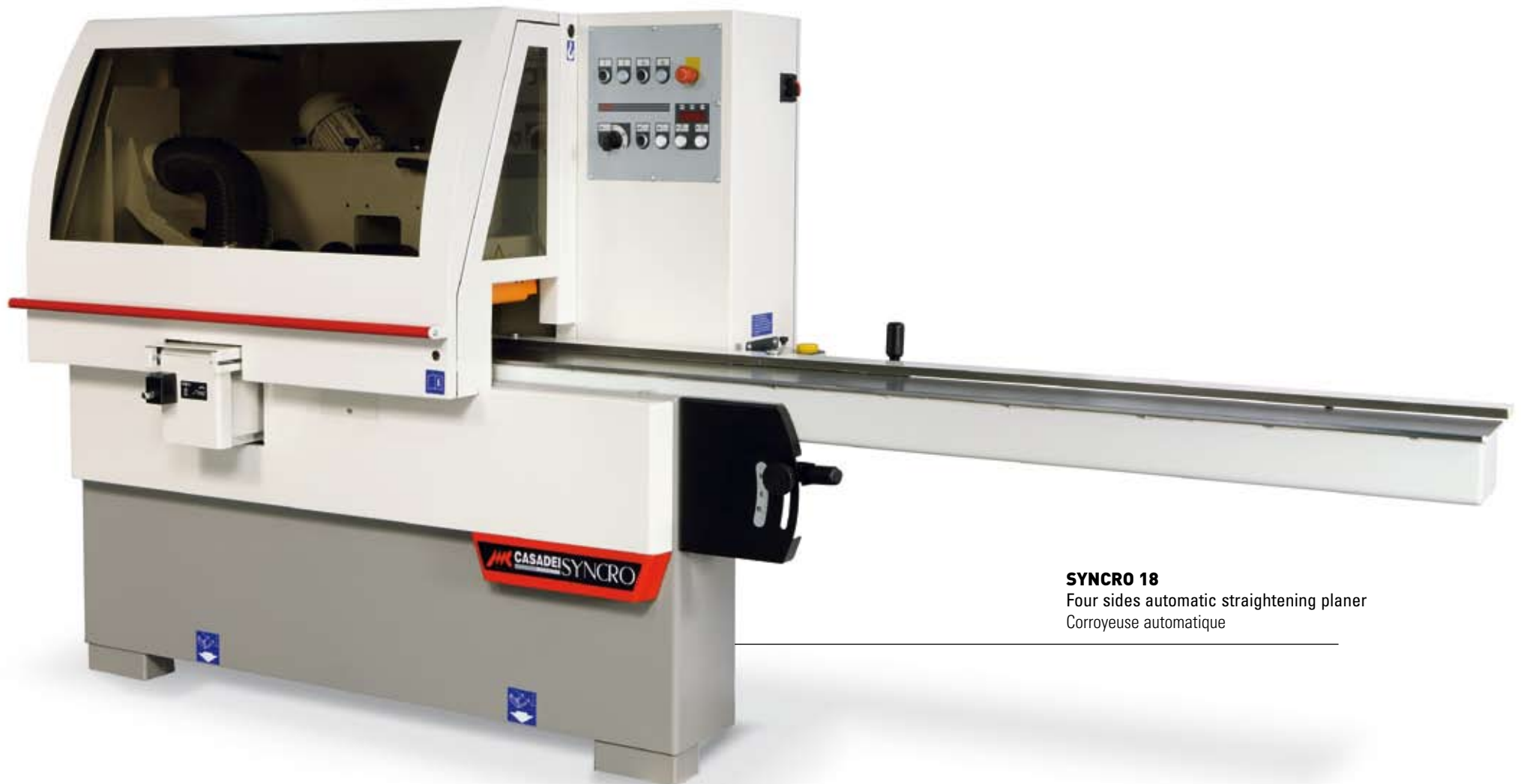
SYNCR0 18 Four sides automatic straightening planer Corroyeuse automatique